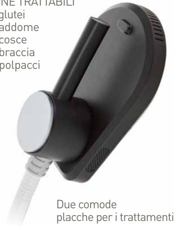
Due comode placche per i trattamenti